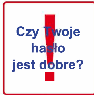
Rysunek 1. Grafika

Witryna internetowa wykorzystuje grafikę, którą należy przygotować. Jest ona zgodna z rysunkiem 1.